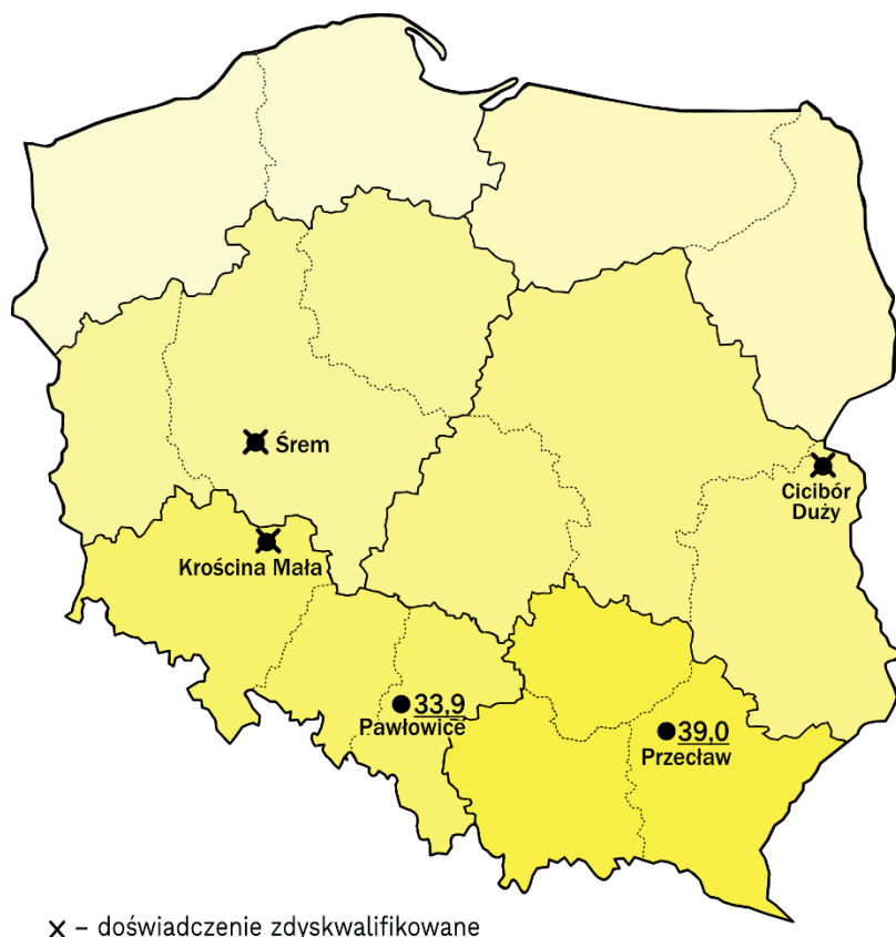
Rys. 7. Rozmieszczenie doświadczeń rozpoznawczych ze słonecznikiem w roku 2025, prowadzonych w systemie PDO

Objaśnienie skali 9-stopniowej (dotyczy tabel wynikowych): 9 – oznacza stan rolniczo najlepszy (najkorzystniejszy); 5 – średni; 1 – oznacza stan rolniczo najgorszy (najmniej korzystny).