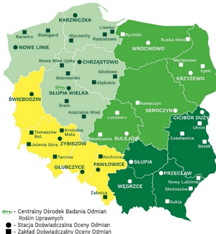
Rys. 1. Rozmieszczenie stacji i zakładów doświadczalnych oceny odmian

Urzędowe badania wartości gospodarczej odmian (WGO) buraka cukrowego przed wpisaniem do Krajowego rejestru (KR), a także doświadczenia w ramach systemu Porejstrowego doświadczalnictwa odmianowego (PDO) realizowane są prawie wyłącznie w sieci stacji (SDOO) i zakładów (ZDOO) doświadczalnych oceny odmian (rys. 1). Natomiast w przypadku buraka pastewnego doświadczenia rejestrowe i PDO prowadzone są okresowo, wyłącznie w sieci doświadczalnej COBORU.